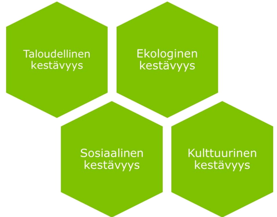
Kuvio 1. Kestävä kehityksen eri ulottuvuudet.