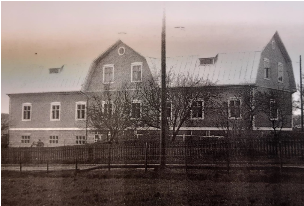
Pyörni kunnalliskodiksi muutettuna v. 1928.