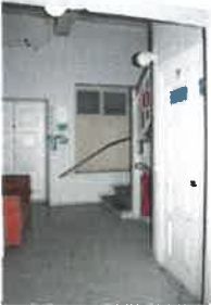
Kuvateksti: Vanhoja väliovia on säilynyt etenkin porrashuoneessa Kuvallaji: yleiskuva Kuvausaika: 9.1.2020