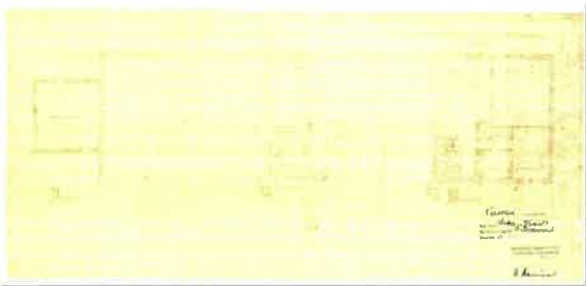
Kuvateksti: Pohjapiirros 2. ja 3. kerros, 1951 Kuvallaji: rakennuspiirustus Kuvaaja: Niina Uusi-Seppä Kuvausaika: 9.1.2020