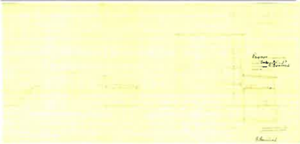
Kuvateksti: Leikkauspiirustus 1951 Kuvallaji: rakennuspiirustus Kuvausaika: 9.1.2020