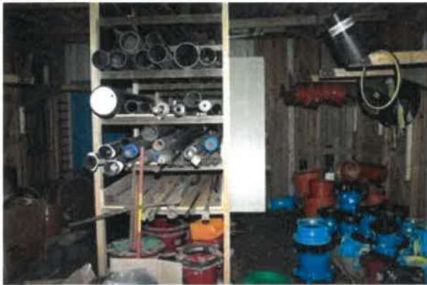
Kuvalaji: yleiskuva Kuvausaika: 9.1.2020