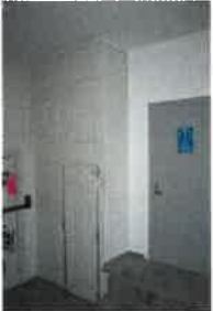
Kuvateksti: Toisen kerroksen porrashuone Kuvallaji: yleiskuva Kuvausaika: 9.1.2020