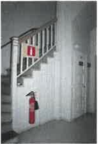
Kuvateksti: Alakerran porrashuone Kuvallaji: yleiskuva Kuvausaika: 9.1.2020