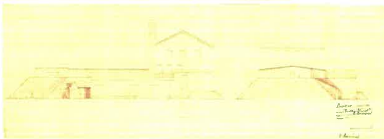
Kuvateksti: Julkisivut, 1951 Kuvallaji: rakennuspiirustus Kuvausaika: 9.1.2020