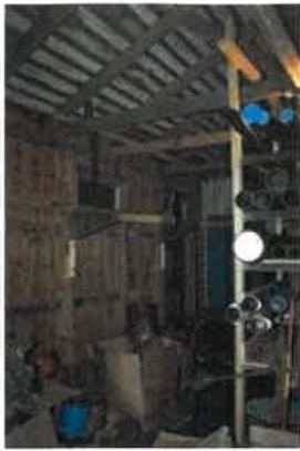
Kuvalaji: yleiskuva Kuvausaika: 9.1.2020