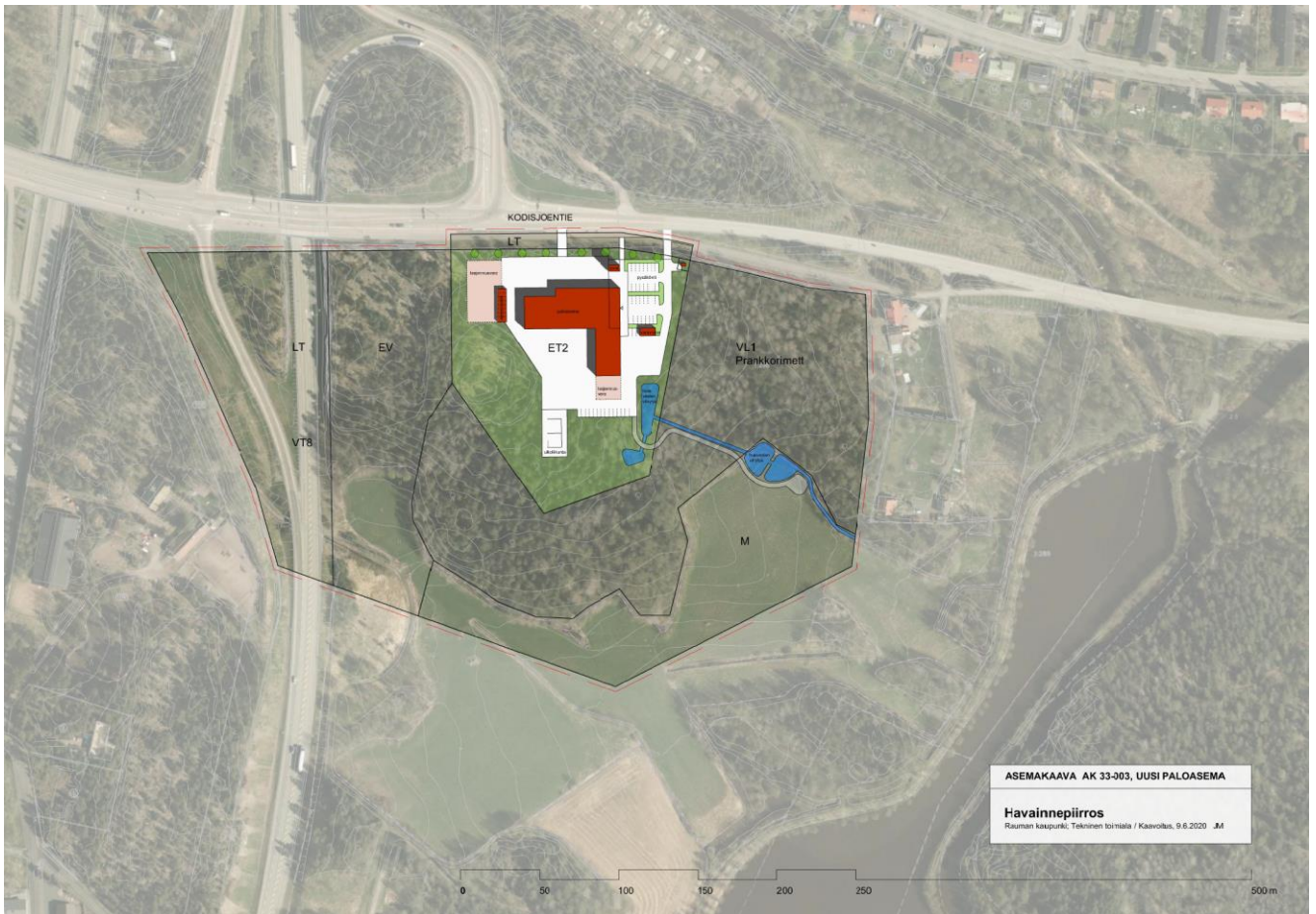
Liite 1. Kaavan havainnepiirros.