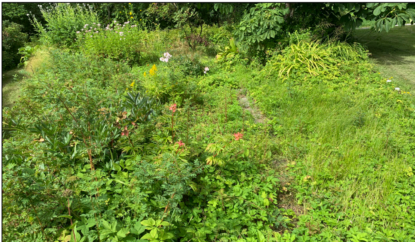
Hyvin sekava perennapenkki kuviolla E.