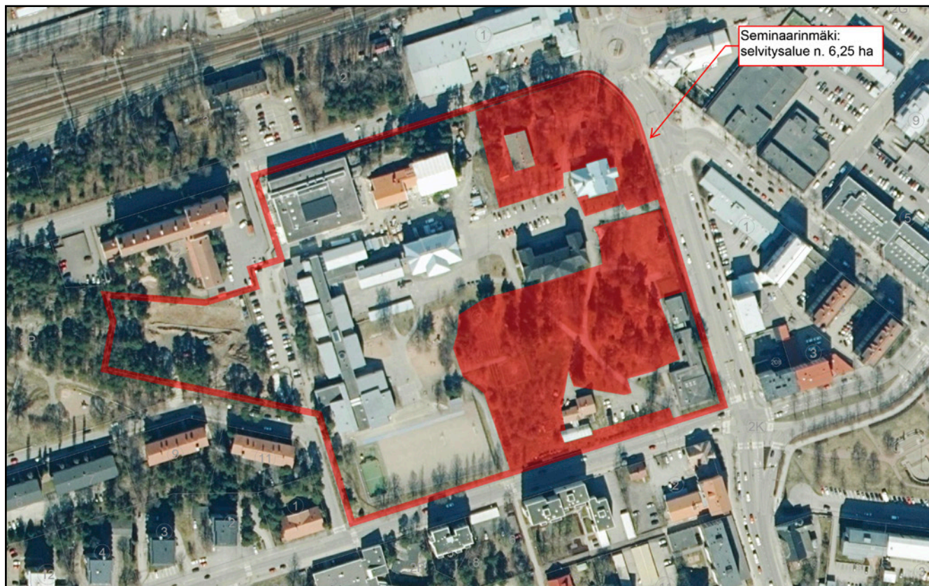
Kuva 3. Arvokas kulttuurikasvillisuusalue (punainen). Ortoilmakuva: Maanmittauslaitoksen avoin data 2020.

Alueelta kirjattiin yhteensä 98 koriste- ja hyötykasvia sekä perennaa ja puuta (taulukko 1). Todellisuudessa Seminaarinmäen alueella on reilusti toistasataa eri istutuskasvilajia. Mikäli mukaan lasketaan kesäkukkamaan ja hyötykasvimaan yksivuotinen lajisto, nousee lajimäärä merkittävästi. Lisäksi alueella esiintyy kymmeniä luonnonvaraisia kasveja, mutta niitä ei listattu, sillä toimeksianto koski kulttuurilajistoa.