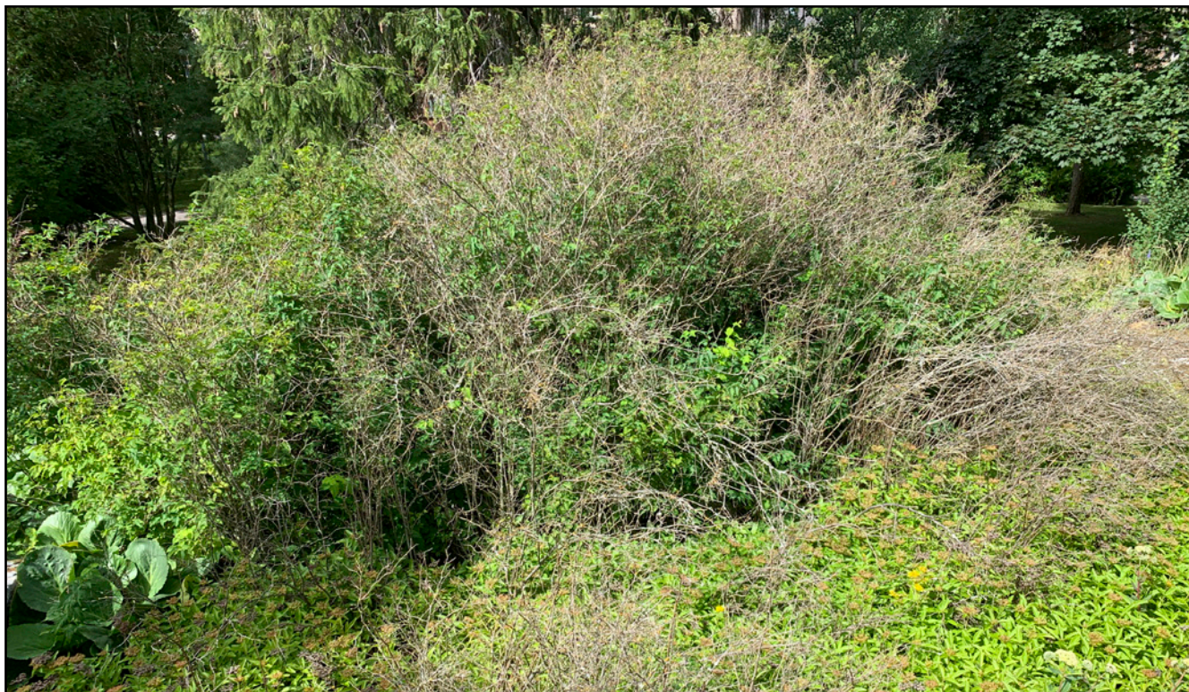
Huonokuntoisia pensaita kuviolla F.