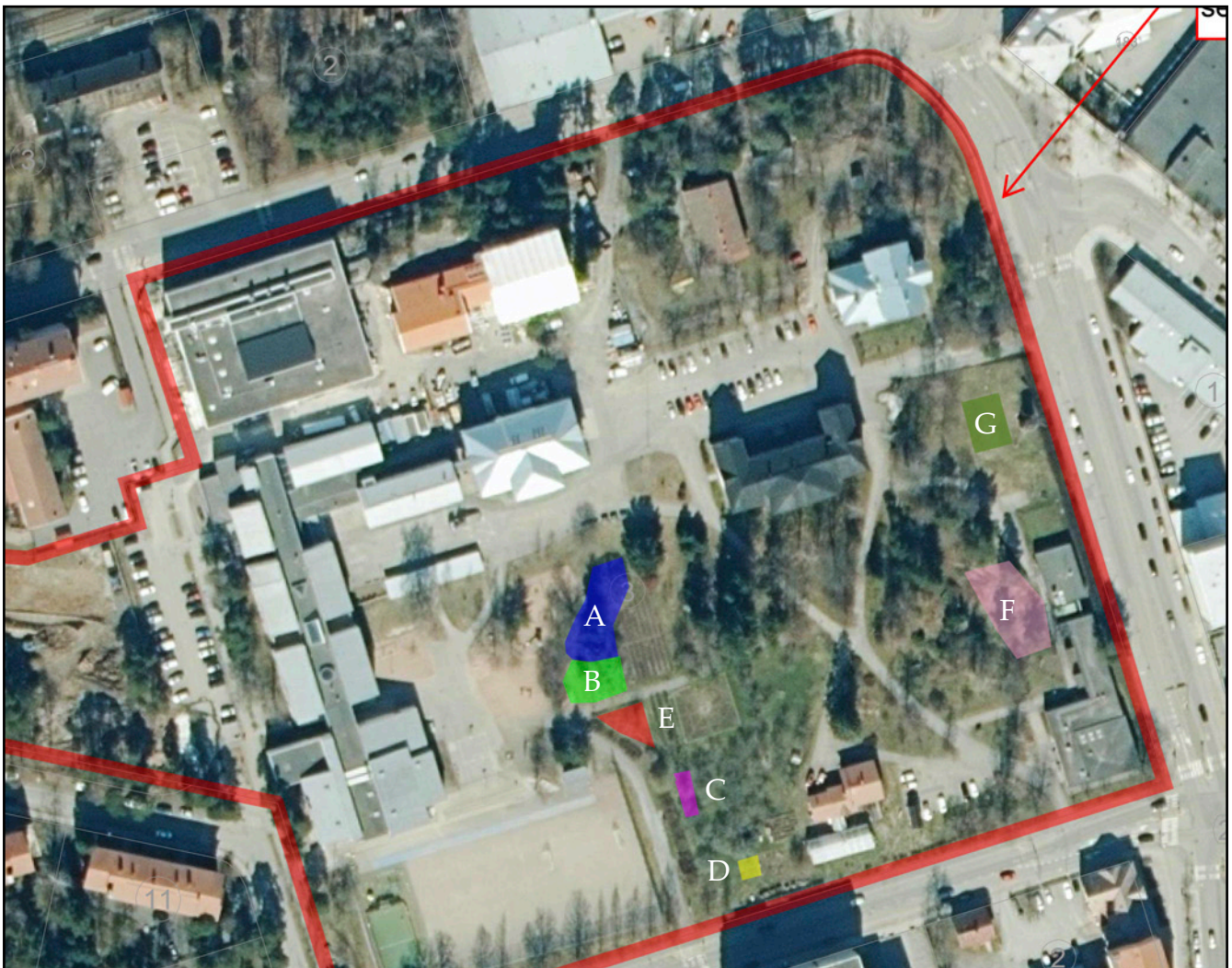
Kuva 4. Hoitosuosituskohteet (A-G). Ortoilmakuva: Maanmittauslaitoksen avoin data 2020.

B) Alueella kasvaa sahalinintatarta (jättitatar), joka on nykyään luokiteltu kansallisesti haitalliseksi vieraslajiksi. Tällaisia vieraslajeja ei saa päästää ympäristöön. Käytännössä laji tulisi hävittää kuvioilta kokonaan siten, että lajin poistettava biomassa ei aiheuta leviämiskälyä läjitysmaalle. Läjitystä ei tule tehdä Seminaarinmäen alueelle.