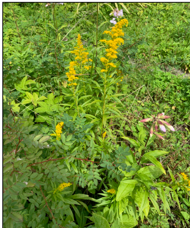
Kuviolla E olevat isopiiskut tulisi poistaa.

Kuviolle D suositetaan laajennattavan mehiläisesien itäpuolella olevaa edustavaa pörräisniittyä.