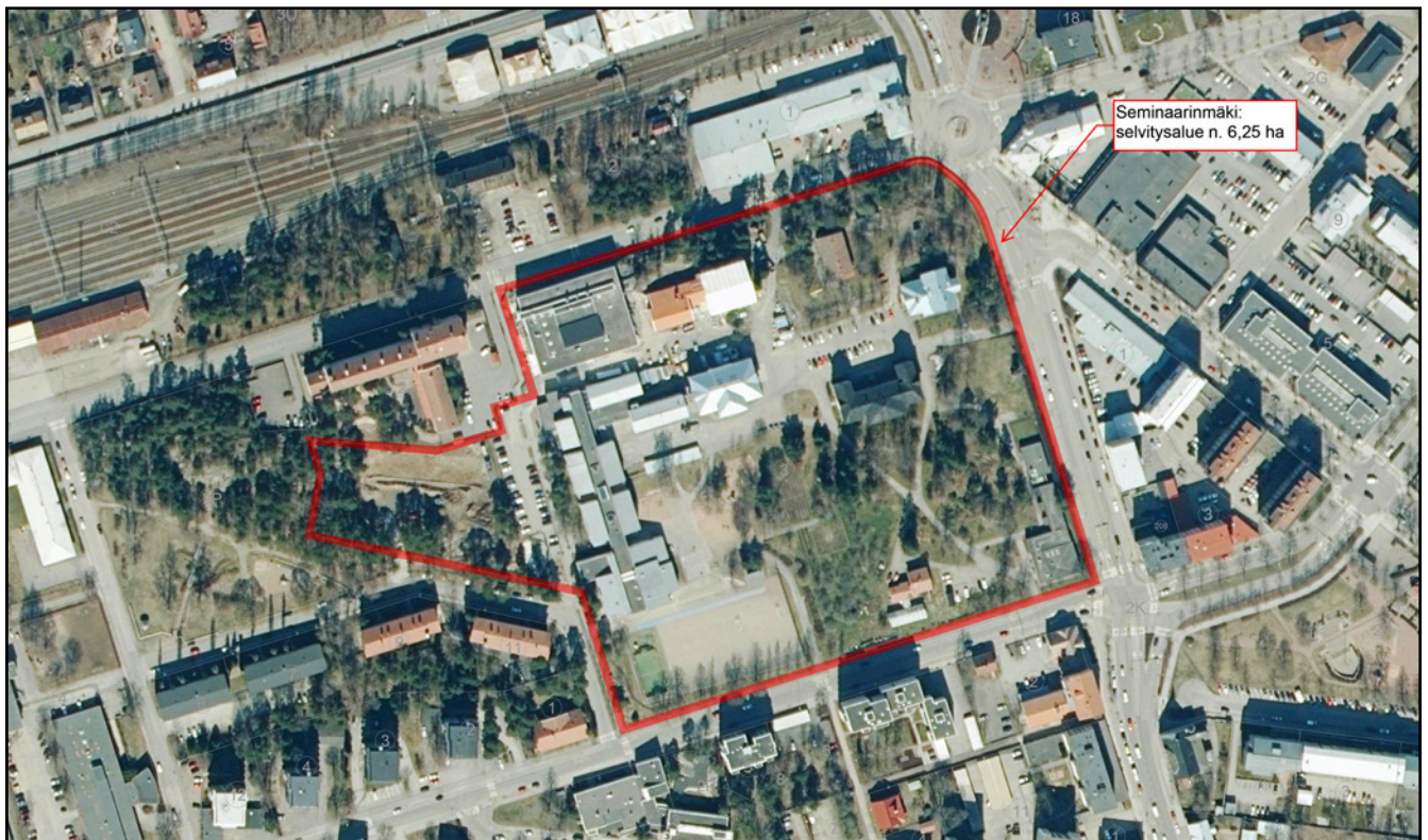
Kuva 2. Tutkimusalue (punainen rajaus).