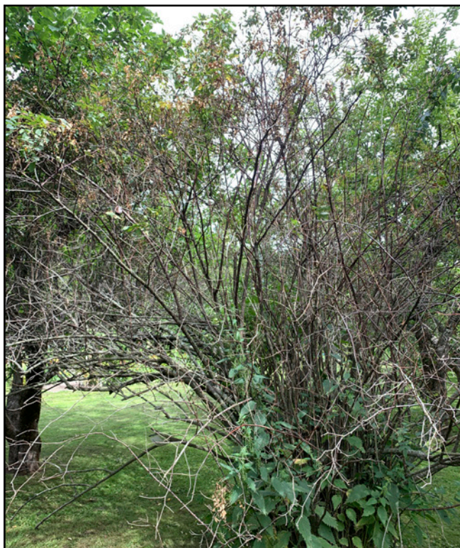
Kuvion C ruusu tulisi leikata tai poistaa.