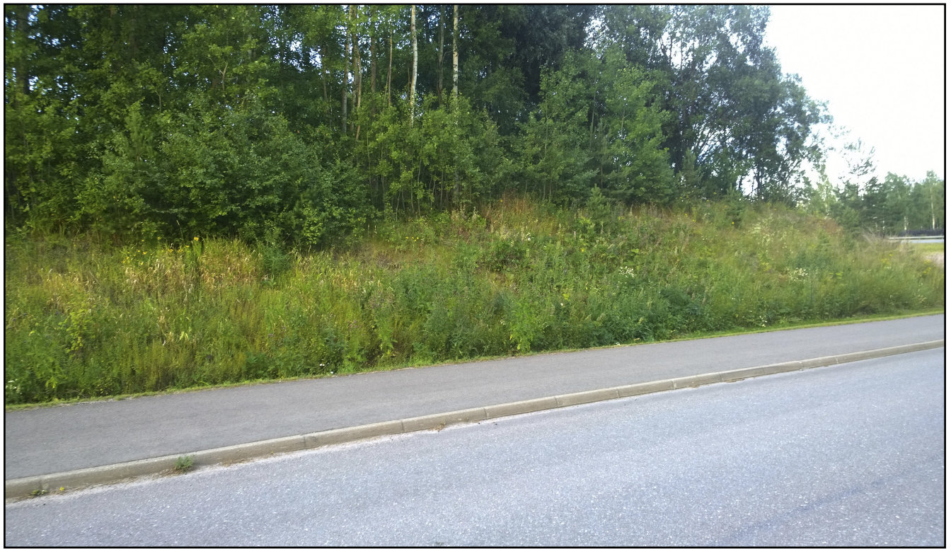
Kuvion 3 tielinjaus.