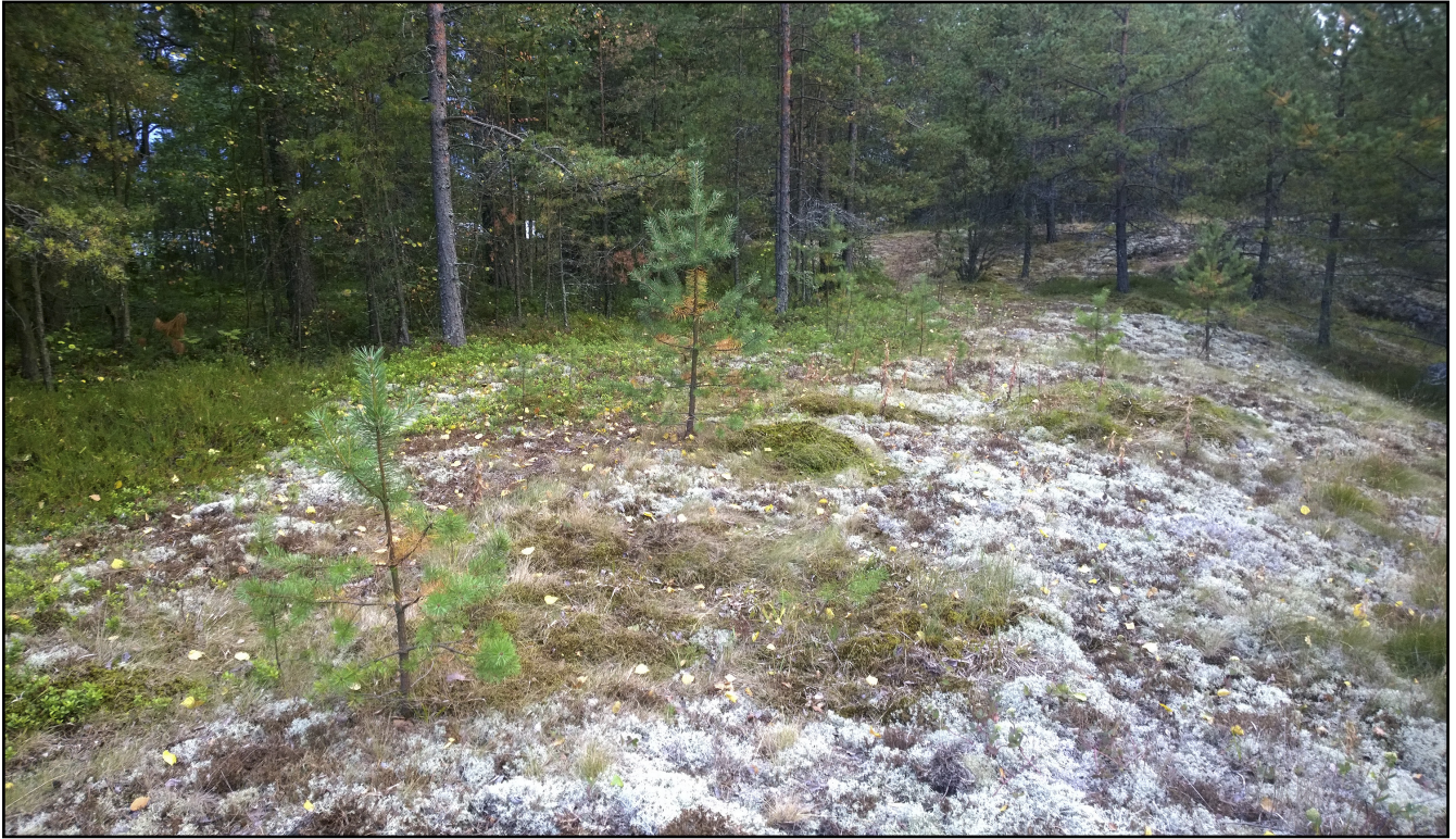
Kuvion 1 kanervatyypin (CT) kuivaa kangasta.