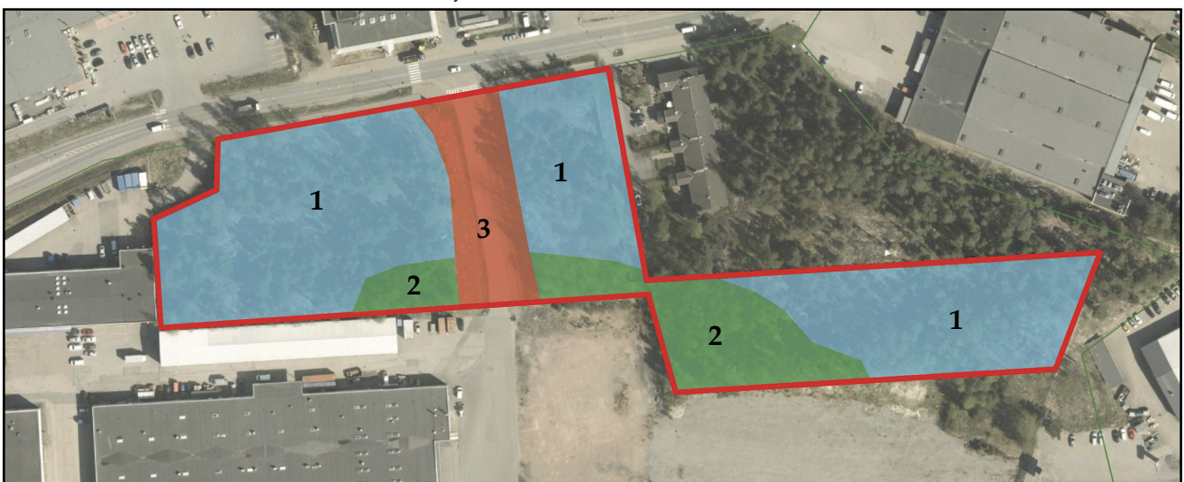
Kuva 2. FereCenterin kuviokohtaiset rajaukset (kuviokartta).

Tässä osiossa kuvataan jokaisen kasvillisuuskuvioiden (kuva 2) yleisluonnehdinta ja maankäyttösuositukset. Lisäksi tietoihin on lisätty luontotyyppien uhanalaisuusluokitus (Raunio ym. 2008). Nämä luokitukset (esimerkiksi EN = erittäin uhanalainen ja NT = silmälläpidettävä) on merkitty punaisella luontotyyppinimikkeen oikeaan reunaan. Mikäli kyseessä on viljelysalue tai jokin muu luontotyyppi, joka uupuu uhanalaisuusluokitukselta, käytetään pelkkää viivaa.