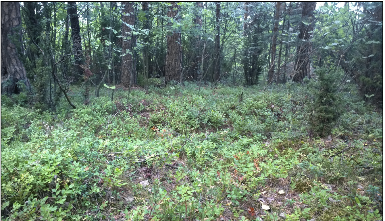
Kuvion 2 mustikkatyypin (MT) tuoretta kangasta.