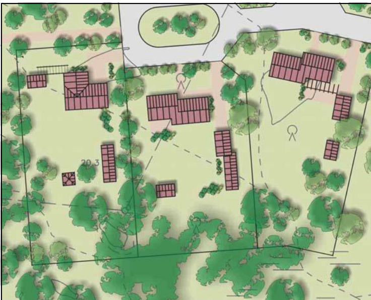
Pihapiirin muodostuminen erillispientalojen korttelialueella.

Suunnittelun tavoitteena on ollut maalaismaiseman ympäristön luominen, mikä voisi tarjota vaihtoehdon niille jotka taajaman sijaan haluavat rakentaa haja-asutusalueille. Alueella on vältetty suurien korttelialueiden muodostamista. Tonteista on tehty väljiä ja niistä on suora yhteys puistoalueille. Tonteilla suositaan useammista rakennuksista koostuvia kokonaisuuksia, joista muodostuu maaseudulle tyyppinen pihapiiri. Rakentamistapa alueella on melko vapaa.