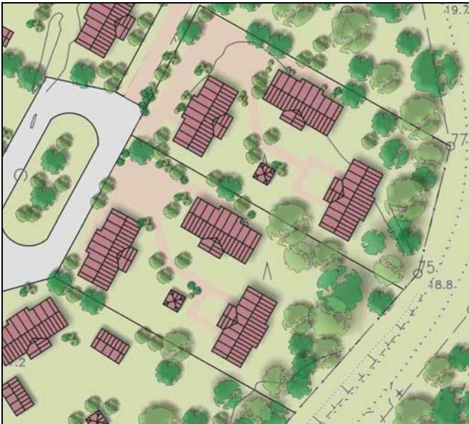
Pihapiirin muodostuminen asuinpienalojen korttelialueella.

Asuinpienalojen korttelialueilla kattomateriaalina pitää käyttää punaista kattotiiltä. Julkisivujen pintamateriaalina pitää käyttää peittomaalattua lauttaa.