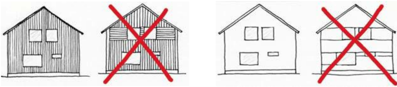
Kuva 3. Julkisivun käsittely.