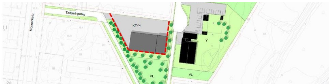
Kuvassa esitetty punaisella katkoviivalla aidalle osoitettu paikka.