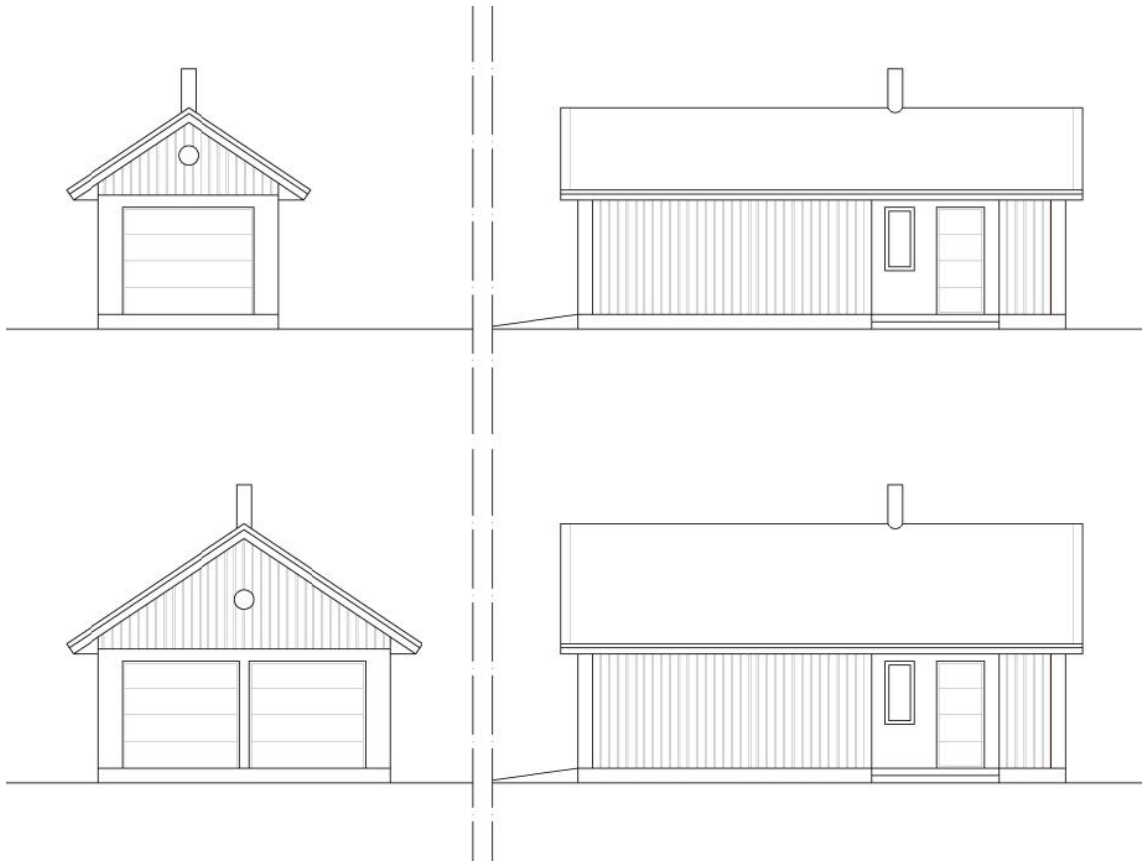
Kuva: Uuden talousrakennuksen tyyppiesimerkkijulkisivukaaviot.