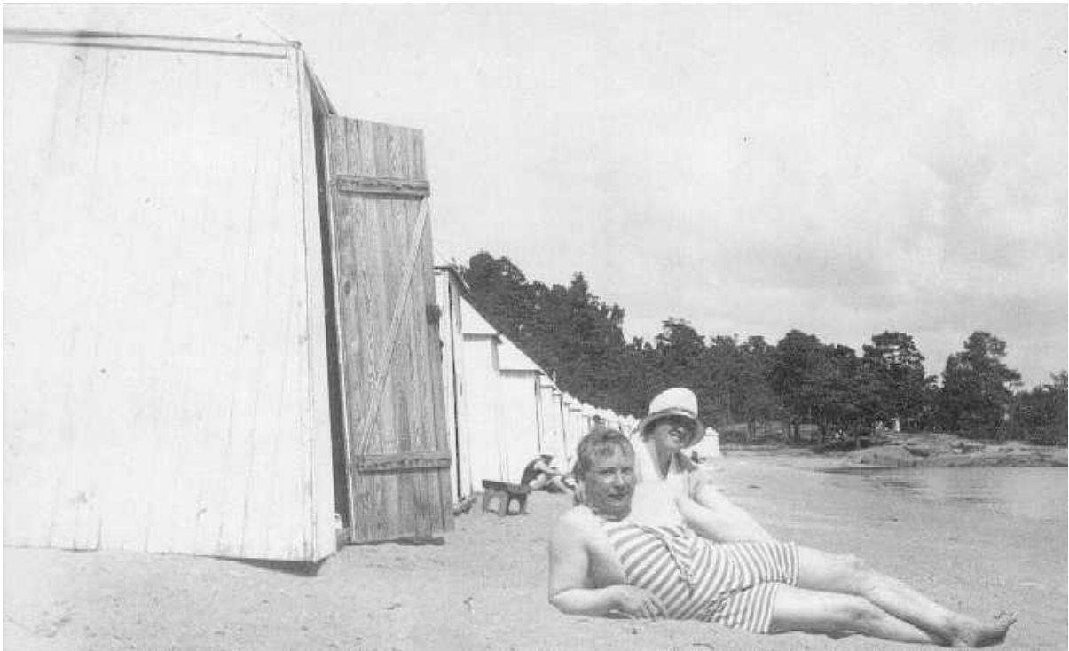
Uimakoppeja Otanlahdessa 1900-luvun alussa.